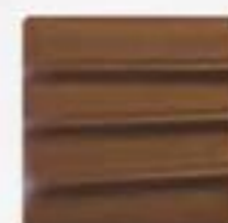
Praliné noix de Pécan