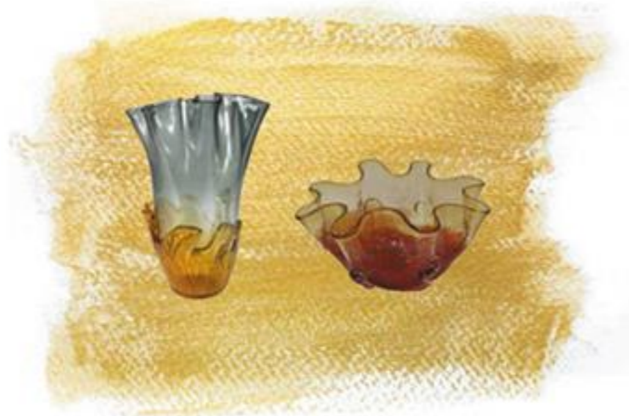
Coupe en verre rouge et doré