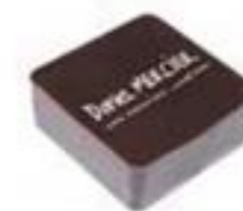
Loix en Ré Noir