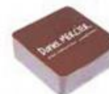
Loix en Ré Lait